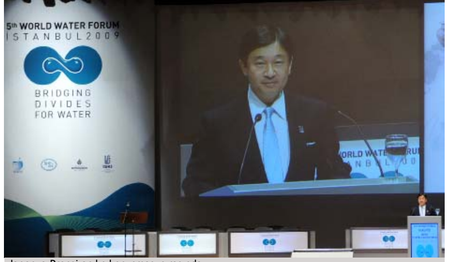
Japonya Prensi açılış konuşması sırasında

Salı günü, katılımcılar Japonya Prensi tarafından sunulan açılış konuşmasını dinlemek üzere toplandılar. Katılımcılar, Amerika ve Avrupa bölgelerinin sunumlarına, üst-düzyer panellere, “küresel değişim ile risk yönetimi” ve “idare ve yönetim” temalı oturumlara katıldılar. Finansmanla ilgili birtakım etkinlikler yapıldı. Ayrıca öğlen arasında ve akşamüstü de yan etkinlikler düzenlendi.