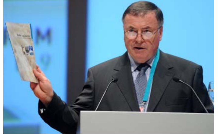
Loïc Fauchon, Dünya Su Konseyi Başkanı

Bu konular şunlardır: afet oluşmadan mobilite ve organizasyonu sağlamak, tahmini rapor verici, haber verici, uyarıcı, ve tahliye edici sistemleri oluşturmak, kalkınmanın planlanmasında afetlerin azaltılması için risk azaltıcı tedbirlerin alınmasını ve iklim değişikliğine uyum sağlanmasını temin etmek, afetlere cevap verme mekanizmalarının iyileştirilmesi ve afet veya uyumsuzluk ortamlarında güvenilir su ve tuvalet hizmetlerinin çabuk verilmesini temin etmek.