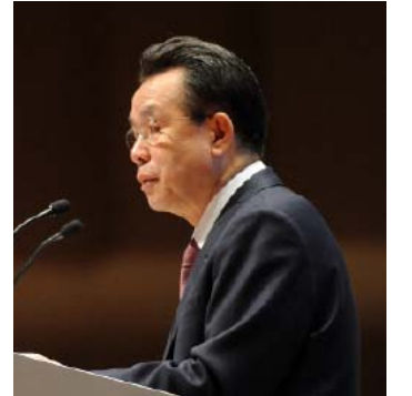
Han Seung-soo, Kore Başbakanı

Kore Başbakanı Han Seung-soo, küresel esnekliği artırmanın gerekliliğine işaret