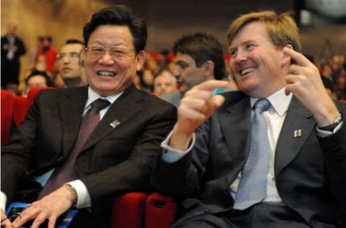
Soldan-sağa: BM Genel Sekreter Yardımcısı Sha Zukang; ve Hollanda Portakal Prensi Willem-Alexander

FİNANS: Finans Yüksek Kurulu Panel Başkanı ve aynı zamanda Türkiye Devlet Bakanı Mehmet Şimşek ekonomik krizden dolayı finansman temininde zorluklar yaşandığını belirtti. Buna rağmen su ve sanitasyon için finansman kaynaklarının en çok ihtiyacı olan insanlara temin edilebilmesi için özel sektörden ve uluslararası finans kuruluşlarından yardım alınabileceğini belirtti.