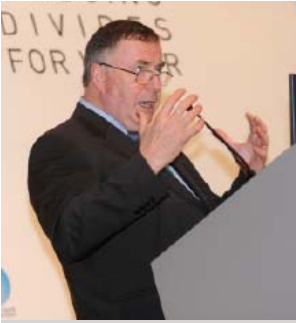
Loïc Fauchon, Dünya Su Konseyi Başkanı

Türkiye Çevre ve Orman Bakanlığı Müsteşarı, Hasan Sarıkaya, tarımda su kullanımının verimini artırmak için sulama teknolojilerine ve altyapısına erişimin mutlaka iş üstünde eğitim ve öğretim ile takviye edilmesi gerektiğini belirtti.