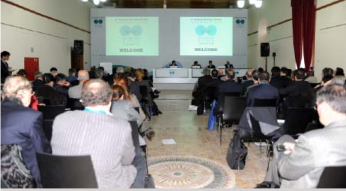
Su ile ilgili risklerin değişen iklimde yönetimi oturumundaki katılımcılar

zararları azaltmak ve zorlukları yenme gücünü artırmak için ihtiyaç duyulan yapılaşma ve alt yapı, sel yönetimi entegrasyon uygulaması ve bilgi değişimine de değindi.