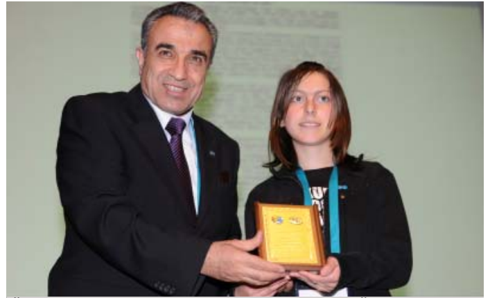
Ödül kazananlardan biri Türk Günü Teknik Oturumu Ödülü Resepsiyonu sırasında ödülünü gösterirken

ise yağmur oranlarında azalma olduğuna dikkat çekmiş ve ileride Türkiye'nin su azlığı ile ilgili sorunlarla karşı karşıya kalacağını sözlerine ekledi.