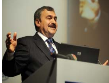
Veyssel Eroğlu, Türkiye Çevre ve Orman Bakanı

Türkiye Çevre ve Orman Bakanlığı'ndan Veyssel Eroğlu, "çevresel değişimlerin" özellikle de kuraklık ve sel yönetimi bağlamında uyum ve zararı azaltma stratejilerinin uygulanmasını gerektiğini anlattı. Su yönetimi ile ilgili yeni ortaya çıkan ortaklıkları memnuniyetle karşıladığını söyledi.