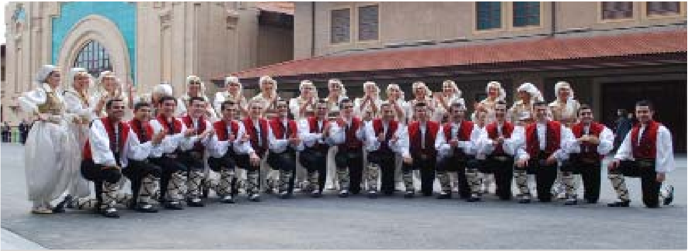
Yerel dansçılar öğleden sonra fotoğrafçılara poz verdi

Anlaşmasına (UESKHA) taraf olmamış olsa da; su ile ilgili insan haklarını ele almak açısından UESKHA'nın yararlı bir başlangıç noktası olduğunu bildirdi.