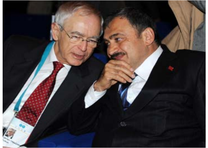
Soldan-Sağa: Oktay Tabasaran, Dünya Su Forumu Genel Sekreteri, ve Veyssel Eroğlu, Türkiye Çevre ve Orman Bakanı