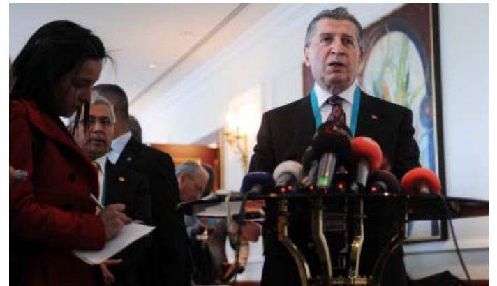
Köksal Toptan, Türkiye Büyük Millet Meclisi