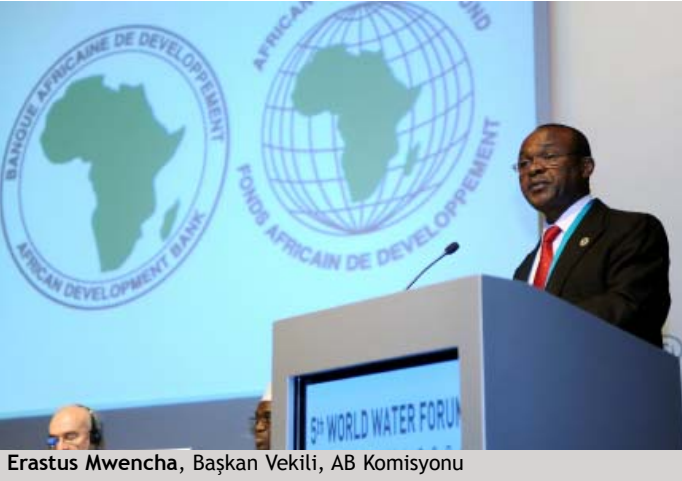
Erastus Mwencha, Başkan Vekili, AB Komisyonu

oluşturulduğunu bununla beraber su ile ilgili sorunların iletilebileceğini sözlerine ekledi. G8 Su ve Sanitasyon Uzman Grubu Başkanı Sfara Giorgio G-8 Afrika Su Müttefikleri nin kurulduğunu bildirdi. Bu müttefiklerin Tokyo ve Evian'dan alınmış dersler ile yola çıkacağını sözlerine ekledi.