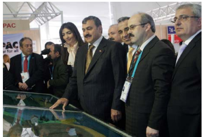
Veysel Eroğlu, Türkiye Orman ve Çevre Bakanı, Dünya Su Sergi ve Fuar açılışı sırasında

DÜNYA SU SERGİSİ VE FUARI: Dünya Su Fuar ve Sergisi Çevre ve Orman Bakanı Veysel Eroğlu tarafından açıldı. Sergide uluslararası su ve çevre firmalarının stantları sergilendi. Sayın Eroğlu Türkiye'de devam eden 5. Dünya Su Forumunun önemini bu denli çok firmanın katılımcı olarak gelmiş olmasından anlaşılabileceğini belirtti.