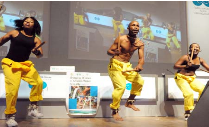
Afrika Bölgesel Gününde Güney Afrika dansçıların gösterileri

Brazilya sözcüsü Narcio Rodriguez, dünya çapında su sorunlarını ele alan parlamenterlerin çabalarını koordine etmek