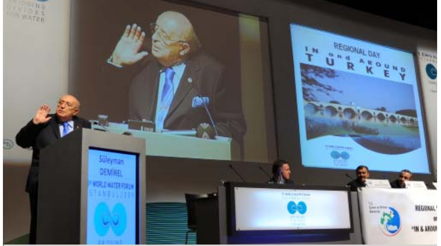
Türkiye'nin geçmiş Cumhurbaşkanı Süleyman Demirel bölgesel "Türkiye'nin içinde ve civarında" adlı oturumdaki katılımcılara hitap etti.

5. Dünya Su Forumu 18 Mart'ta İstanbul, Türkiye'de devam etti. Katılımcılar Afrika ve "Türkiye'nin içi ve çevresindeki" bölgeleriyle ilgili bölgesel sunumlara katıldılar. Parlamenterler gün boyunca siyasi sürecin parçası olan sonuçları hazırlamak amacıyla toplandılar. Parlamenterler aynı zamanda tematik oturumlara ve yan etkinliklere katıldılar. Su Fuarı ve Su Sergisi ise Forumun iki ayrı toplantı yerinde devam etti.