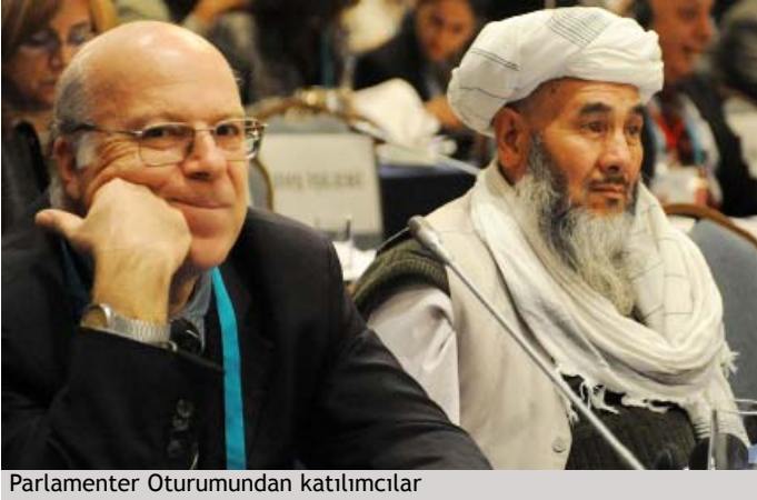
Parlamenter Oturumundan katılımcılar

üzere, DSK ve BMEKÖ- Uluslararası Hidroloji Programı, (UHP)'nin koruması altında kalıcı küresel su parlamentosunun oluşturulması çağrısında bulundu. Bununla beraber Latin Amerika'nın karşı karşıya olduğu suya ulaşmanın adaletsizliği; yeraltı su kaynakları üzerine olan yetersiz yasalar; ve su hizmetleri, fiyatlandırma, ve ekosistem hizmetleri ödemesi üzerine olan yasamanın etkin olmaması hususları üzerinde durdu.