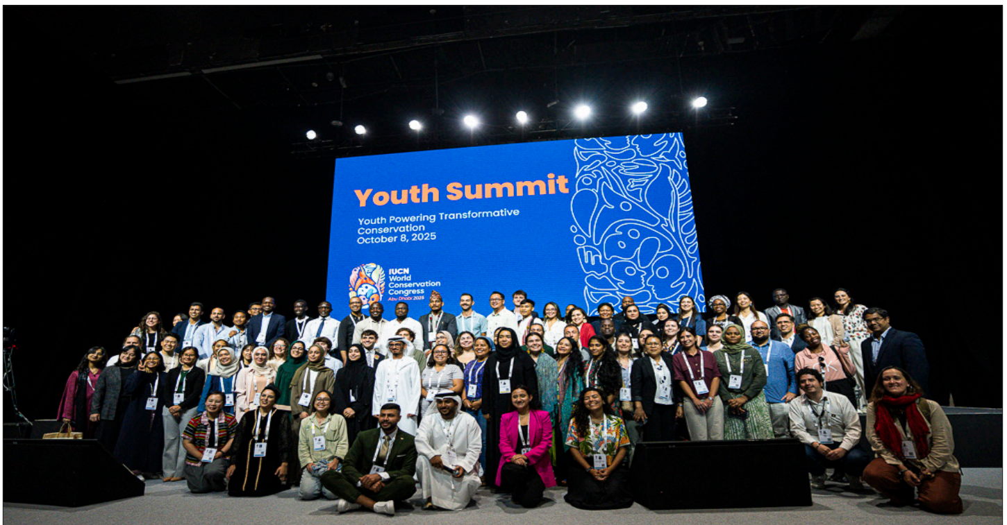
Foto de grupo al final de la cumbre