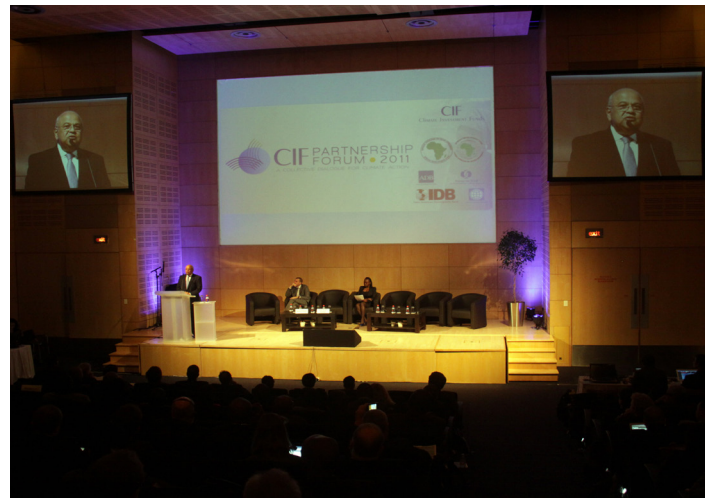
Pravin Gordhan, Ministre des finances d'Afrique du Sud, pendant son discours d'ouverture de l'édition 2011 du Forum de partenariat des FIC.

celle du Sous-comité du SREP ; celle du Comité du fonds d'affectation du FTP ; et celle du Sous-comité du Fonds stratégique pour le climat (FSC). Par ailleurs, des consultations auprès des OSC se sont organisées en amont du Forum pour