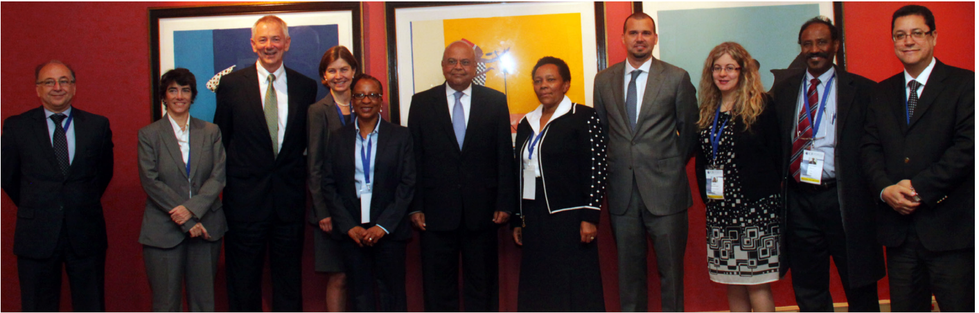
Pravin Gordhan, Ministre des finances d'Afrique du Sud (centre) avec des personnalités du forum.