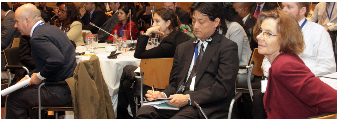
Participants présents au groupe de travail Financer la transformation

et la mise en œuvre de solutions d'atténuation et d'adaptation devraient se faire sur la base d'un message « crédible et défendable » sur les changements climatiques, aux niveaux global, régional et local. Elle a ajouté que ceci est possible au moyen d'une combinaison de facteurs, notamment :