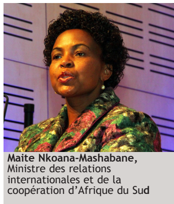
Maite Nkoana-Mashabane, Ministre des relations internationales et de la coopération d'Afrique du Sud