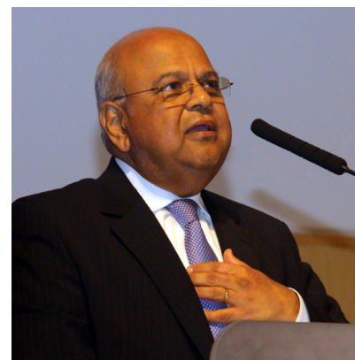
Pravin Gordhan, Ministre des finances d'Afrique du Sud

L'édition 2010 du Forum de partenariat des CIF, qui a eu lieu les 18 et 19 mars 2010 au siège de la Banque asiatique de développement (BAD) à Manille, aux Philippines, avait pour but d'offrir une plateforme ouverte, transparente et constructive pour que toutes les parties prenantes puissent réfléchir ensemble sur la première année opérationnelle des FIC, partager leurs expériences et les connaissances acquises, et tirer des enseignements utiles