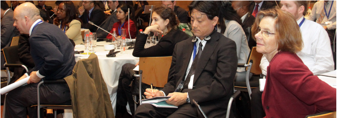
Participantes en la sesión del panel sobre Financiando la Transformación

la predicción climática a corto plazo, y describió los métodos empíricos que se utilizan para generar datos climáticos intertemporales y de corto plazo.