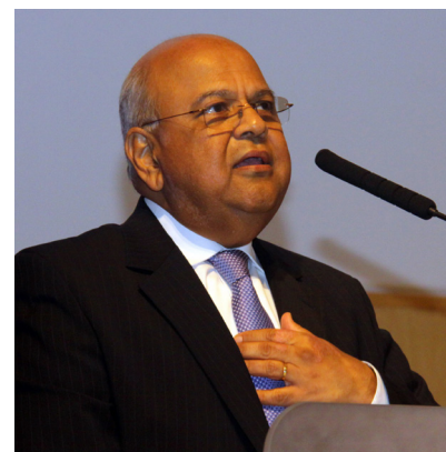
Hon. Pravin Gordhan, Ministro de Hacienda de Sudáfrica

El Foro de los CIF 2010, el cual se celebró del 18 al 19 de marzo de 2010, en la Sede del Banco Asiático de Desarrollo en Manila, Filipinas, tuvo el objetivo de proporcionar una plataforma abierta, transparente y constructiva para todas las partes interesadas con el fin de reflexionar sobre el primer año de operaciones de los CIF, compartir experiencias y conocimientos adquiridos, y extraer lecciones útiles aprendidas que permitan informar la futura implementación de los CIF. Asimismo, el Foro 2010 tuvo el objetivo de compartir las lecciones aprendidas del proceso de diseño de los CIF y la implementación temprana de los programas