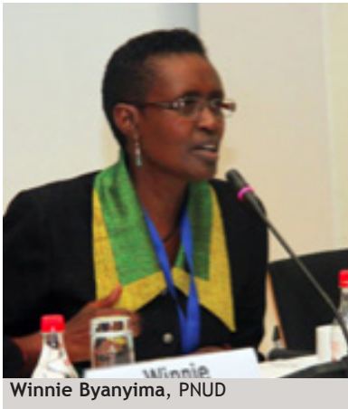
Winnie Byanyima, PNUD