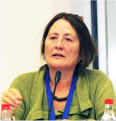
Bente Weisser , Miembro del Subcomité del SREP y Ministra de Asuntos Internacionales, Noruega

y grupos vulnerables; afrontar las limitaciones de recursos humanos; y mejorar la coordinación de donantes al interior del país.