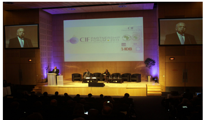
Hon. Pravin Gordhan, Ministro de Hacienda de Sudáfrica, en su discurso de apertura del Foro 2011 de los CIF

El Foro contó con: sesiones plenarias abordando las perspectivas de los diferentes sectores, las experiencias y reflexiones sobre las orientaciones estratégicas, resultados e impactos de los CIF; y paneles de discusión sobre las maneras de maximizar el impacto de los CIF en los niveles nacional y sectorial. Además, los participantes se reunieron en un panel de organizaciones de la sociedad civil (OSC) y ocho sesiones de trabajo sobre temas relacionados con: la participación del sector privado en la adaptación; transporte amigable al clima ( climate-smart mobility ); la promoción de la fabricación de tecnologías limpias; asociaciones innovadoras; modelos climáticos; financiando la transformación; energía eólica; y trabajando como socios a nivel nacional. Los participantes también recibieron los mensajes de las reuniones de los países piloto y las presentaciones sobre las lecciones aprendidas. Se llevó a cabo, además, un simposio de aprendizaje sobre los últimos avances en la ciencia del clima, así como una sesión de pósteres mostrando la evolución de los programas y proyectos de los CIF en 45 países piloto. El Foro fue precedido por reuniones de los: países piloto del Programa de Aumento del Aprovechamiento de Fuentes Renovables de Energía en los Países de Ingreso Bajo (SREP, por sus siglas en inglés), el Programa de Inversión Forestal (FIP, por sus siglas en inglés) y el Programa Piloto sobre Resiliencia Climática (PPCR,