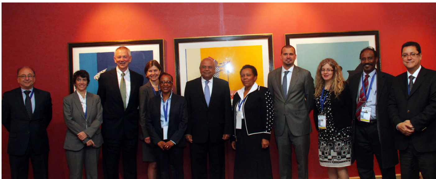
Hon. Pravin Gordhan Ministro de Hacienda de Sudáfrica, (centro) con personas VIP del Foro.

Secretaría de la CMNUCC teléfono: +49-228-815-1000 fax: +49-228- 815-1999 correo electrónico: secretariat@unfccc.int www: http://www.unfccc.int