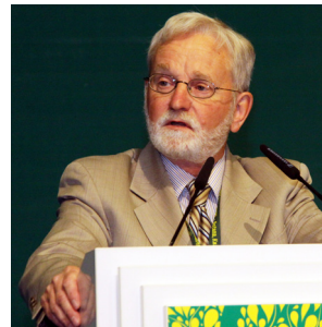
Джералд Фартинг, Заместитель министра образования Манитобы, Канада

Йохен Флашбарт, Президент Федерального германского экологического агентства, поделился немецким опытом следования по пути зеленой экономики, что позволило создать 630 тысяч новых рабочих мест и помогло Германии преодолеть глобальный экономический кризис. Он признал, что некоторые страны пока находятся на