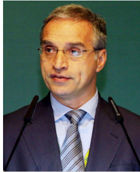
Горан Свиланович, Координатор экономической и экологической деятельности, Организация по безопасности и сотрудничеству в Европе

Горан Свиланович, Координатор экономической и экологической деятельности, Организация по безопасности и сотрудничеству в Европе, подчеркнул важность окружающей среды как ключевого компонента мира и безопасности. Он связал озеленение экономики с совершенствованием управления и устойчивости к изменению климата и призвал к включению Программы партнерства «Зеленый мост» в процесс Рио+20.