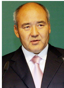
Первый заместитель Премьер-Министра Казахстана Умирзак Шукеев

В среду Первый заместитель Премьер-Министра Казахстана Умирзак Шукеев приветствовал участников и представил Программу партнерства «Зеленый мост», призванную содействовать сотрудничеству между Азией,