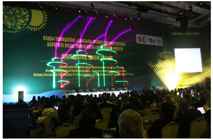
Заседание началось с впечатляющего лазерного представления

Шестая Конференция министров проходила в Белграде, Сербия, с 10 по 12 октября 2007 г. Министры и должностные лица высокого уровня из 51 государства-члена ЕЭК ООН, а также Европейская комиссия, международные организации, неправительственные организации и другие представители заинтересованных сторон обсудили прогресс, достигнутый в осуществлении природоохранной политики после Киевской конференции 2003 года, укрепление национальных потенциалов и партнерства, и будущее процесса ОСЕ. Министры обязались наращивать усилия для достижения Целей развития тысячелетия и осуществить Йоханнесбургский