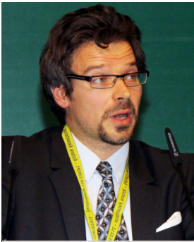
Вилле Нинисто, Министр окружающей среды Финляндии

уровне, в более объемлющих исследованиях воздействия изменения климата.