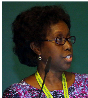
Летиция Обенг, Председатель Глобального водного партнерства