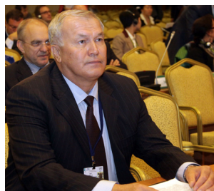
Сагит Ибатуллин, Председатель Исполнительного комитета Международного фонда спасения Аральского моря

радиоактивного заражения подземных вод. Она обратилась с призывом к правительствам ратифицировать и выполнить Протокол по проблемам воды и здоровья, выделить средства для капиталовложений в санитарную для малых местных общин и ликвидировать пробелы в вопросах загрязнения от горнодобычи.