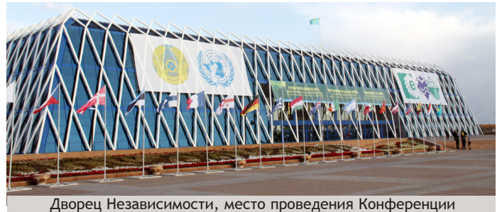
Дворец Независимости, место проведения Конференции

Седьмая Конференция министров «Окружающая среда для Европы» прошла с 21 по 23 сентября 2011 г. во Дворце Независимости в Астане, Казахстан. Процесс «Окружающая среда для Европы» (ОСЕ), начавшийся в 1991 г., является единственным в своем роде партнерством государств, принадлежащих к региону Европейской экономической комиссии ООН (ЕЭК ООН), а также учреждений системы ООН, представленных в этом регионе, других межправительственных организаций, региональных экологических центров, неправительственных организаций, частного сектора и других основных групп.