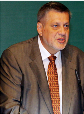
Ян Кубиш, Исполнительный секретарь ЕЭК ООН

институциональных механизмов сотрудничества и многосторонних природоохранных соглашений и партнерств с заинтересованными сторонами. Кубиш заметил, что, несмотря на достигнутый значительный успех в водном секторе, прогресс во всем регионе ЕЭК ООН остается неравномерным и водные ресурсы все еще испытывают огромный стресс. Среди имеющихся трудностей – слабая практика управления, чрезмерная эксплуатация ресурсов, неустойчивое потребление, недостаточные капиталовложения в инфраструктуру и низкая