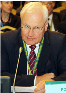
Анджей Крашевский, Министр окружающей среды Польши

Анджей Крашевский, Министр окружающей среды Польши, выступая от имени Европейского союза и его государств-членов, отметил, что процесс ОСЕ служит моделью для реализации принципа 10 Декларации Рио, т.к. он содействует активному участию широких кругов заинтересованных сторон в защите окружающей среды и обмене опытом. Он подчеркнул, что обеспечение безопасного доступа к питьевой воде занимает приоритетное положение в повестке дня ЕС, и приветствовал Астанинскую инициативу по воде. Он высказался за проведение регулярных экологических оценок и одобрил предложение о Программе партнерства «Зеленый мост», но просил прояснить ее структуру управления.