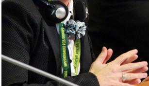
Кейт Пентус, Министр окружающей среды Эстонии

Кейт Пентус, Министр окружающей среды Эстонии, приветствовала Вторую оценку состояния трансграничных рек, озер и подземных вод и призвала к скорейшему выполнению содержащихся в ней рекомендаций. Она сказала, что в будущем потребуются регулярные оценки.