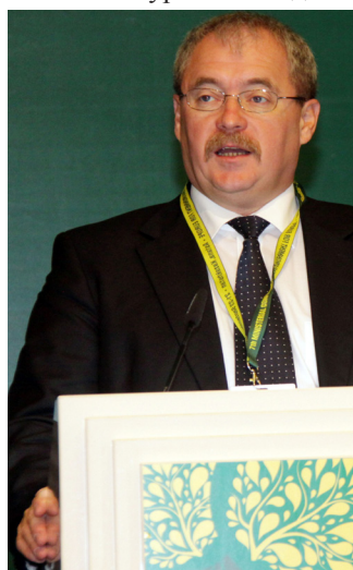
Шандор Фазекаш, Министр сельского развития Венгрии

Георге Шалару, Министр окружающей среды Республики Молдова, осветил инициативы его страны в области трансграничного сотрудничества с Румынией в бассейнах рек Прут и Дунай, а также с Украиной в бассейне Днестра. Он подчеркнул значение политического диалога в качестве важного фактора устойчивой