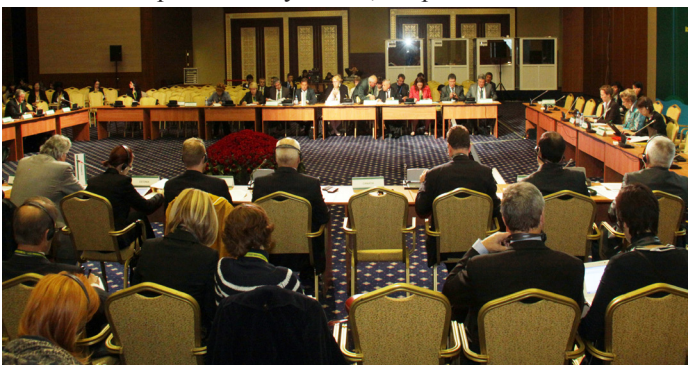
Заседание круглого стола 1