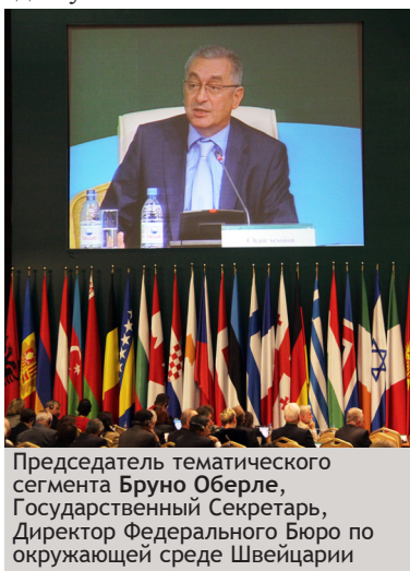
Председатель тематического сегмента Бруно Оберле, Государственный Секретарь, Директор Федерального Бюро по окружающей среде Швейцарии

Саймон Аптон, Директор директората по окружающей среде, Организация экономического сотрудничества и развития, сказал, что нехватка воды может угрожать экономическому развитию. Он выделил эффективное