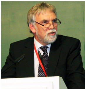
Йохен Флашбарт, Президент Федерального германского экологического агентства

в Узбекистане для улучшения и модернизации водного и сельскохозяйственного секторов, включая государственные капиталовложения в реконструкцию ирригационной и дренажной инфраструктуры и использование улучшенных сортов и технологий. Он подчеркнул, что переход к зеленой экономике может уменьшить опасности, кроющиеся для экономического развития в неустойчивом спросе на воду.