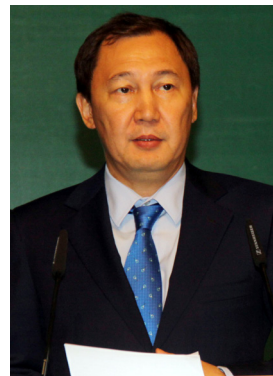
Председатель Конференции Нурғали Ашим, Министр охраны окружающей среды Казахстана

Председатель Конференции Ашим представил Программу партнерства «Зеленый мост» (ECE/ASTANA.CONF/2011/6) и заявил, что, несмотря на наличие множества международных природоохранных программ, меры, предпринимаемые правительствами, отстают из-