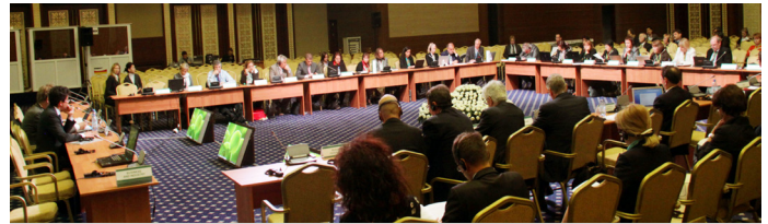
Заседание круглого стола 2

климата. Участники отдали должное Водной рамочной директиве ЕС (ВРД) как политическому инструменту, учитывающему относящиеся к воде экосистемные услуги и направленному на достижение баланса между различными видами использования воды. Страны подчеркивали необходимость соблюдения существующих правил и международных конвенций, включая Протокол по проблемам воды и здоровья, при этом делая упор на координации и сотрудничестве.