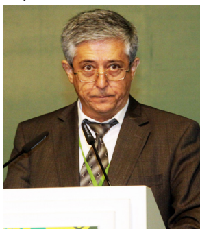
Камалитдин Садыков, Заместитель председателя Государственного комитета охраны природы Узбекистана

Камалитдин Садыков, Заместитель председателя Государственного комитета охраны природы Узбекистана, рассказал об экологических проблемах страны. Это - высокое потребление энергии, загрязнение водных ресурсов, потеря воды в ирригационных системах, сокращение плодородия и деградация земель. Он сообщил о мерах, принятых