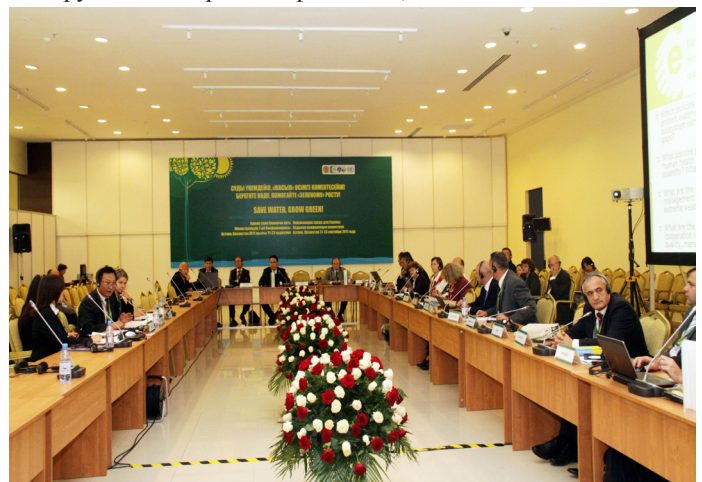
Заседание круглого стола 3