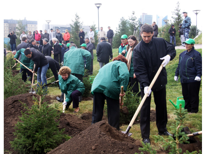
Церемония посадки деревьев в Этно-мемориальном комплексе