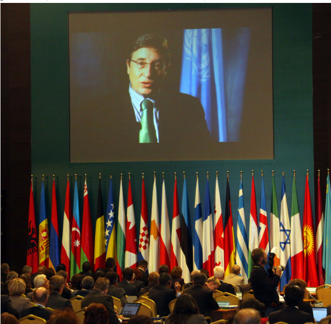
Участники прослушали видеопослание от Ахима Штайнера, Исполнительного директора ЮНЕП