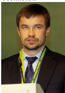
Ринат Гизатулин, Заместитель Министра природных ресурсов и охраны окружающей среды Российской Федерации