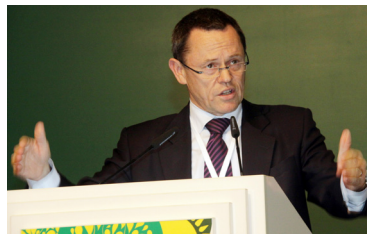
Саймон Аптон, Директор директората по окружающей среде, Организация экономического сотрудничества и развития

водопользование, установление цены на воду в зависимости от ее нехватки и для создания стимулов, финансирование водных ресурсов и распределение воды среди конкурирующих видов ее назначения.