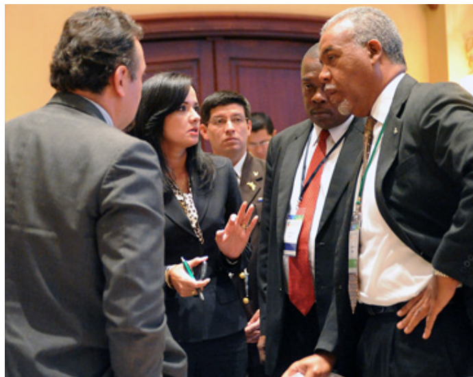
La Presidenta Aguiñaga consulta a los delegados de Bolivia, Haití y Bahamas

Ecuador dijo que promover la economía verde sin modificar los patrones de producción y consumo es una forma de proteccionismo, y sugirió que las discusiones sobre el borrador cero se centraran en limitar el consumo más que en expandir la economía verde. Respecto al MIDS, dijo que las agencias