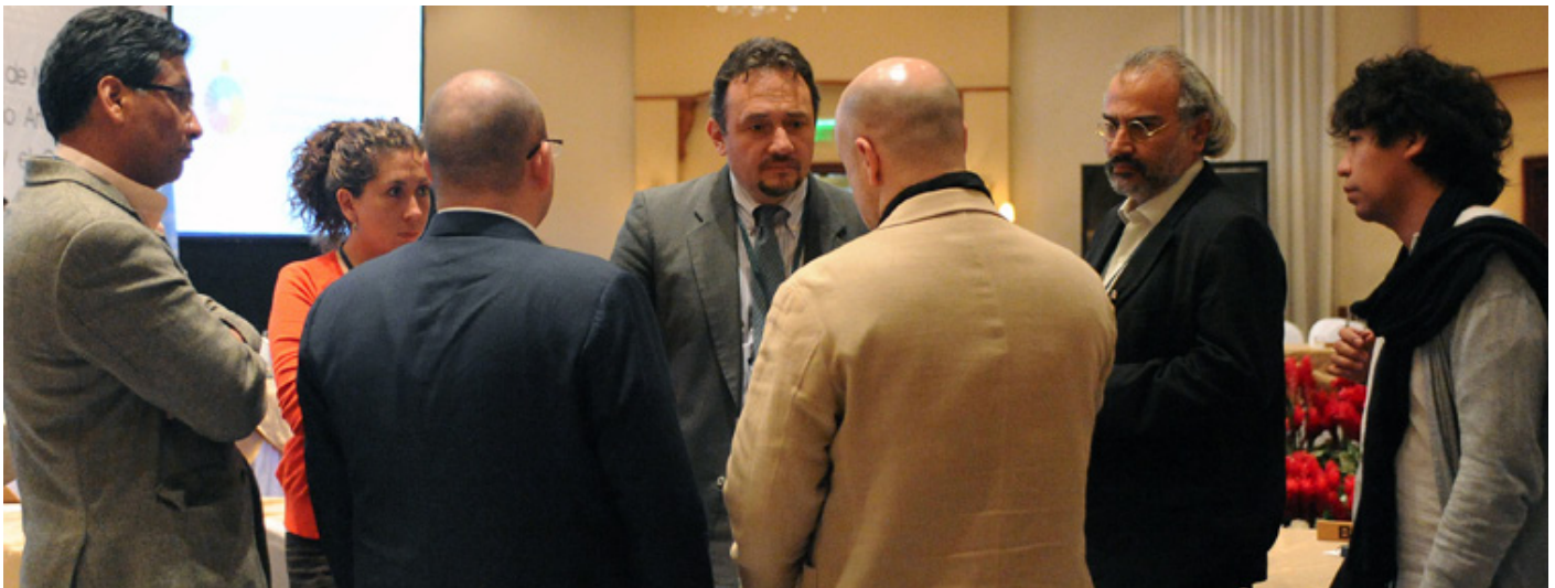
La delegación boliviana con Paraguay

Colombia pidió que se aceptara la propuesta de las MDS y que el Foro como grupo las llevara a Río+20. Dijo que las MDS: serían aplicables universalmente e implementadas en toda la nación, respetando las instituciones de cada país; tendrían componentes económicos, sociales y ambientales; y tendrían el objetivo primordial de reducir la pobreza. Propuso que se seleccionaran cuestiones incluyentes, mencionando, como ejemplos, seguridad alimentaria, agua, energía, océanos, ciudades sostenibles, salud y empleo. Subrayó que las MDS no serían una amenaza para los Objetivos de Desarrollo del