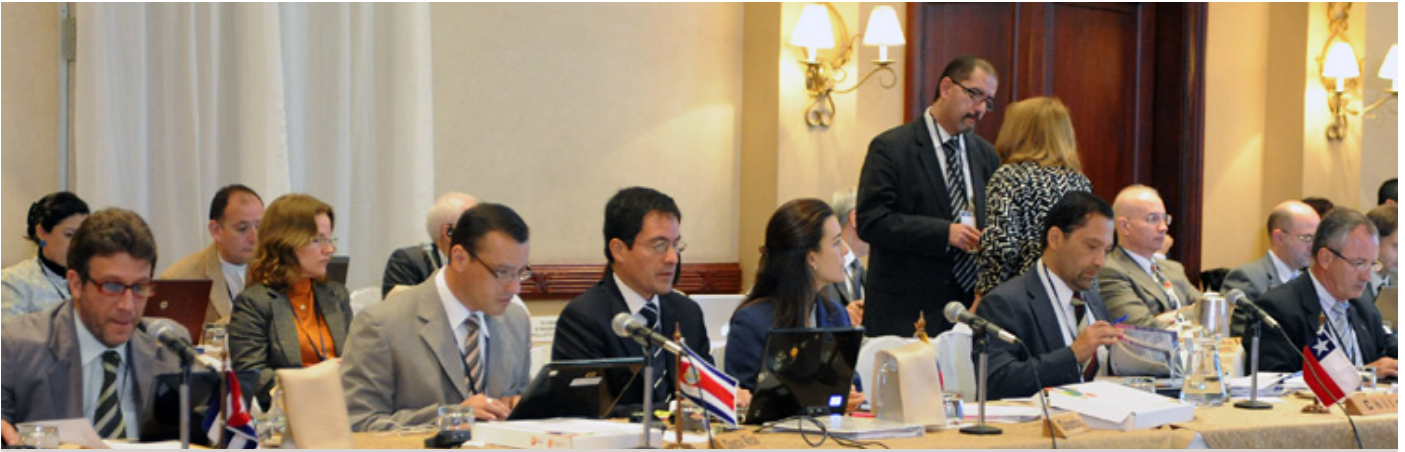
Participantes durante la reunión