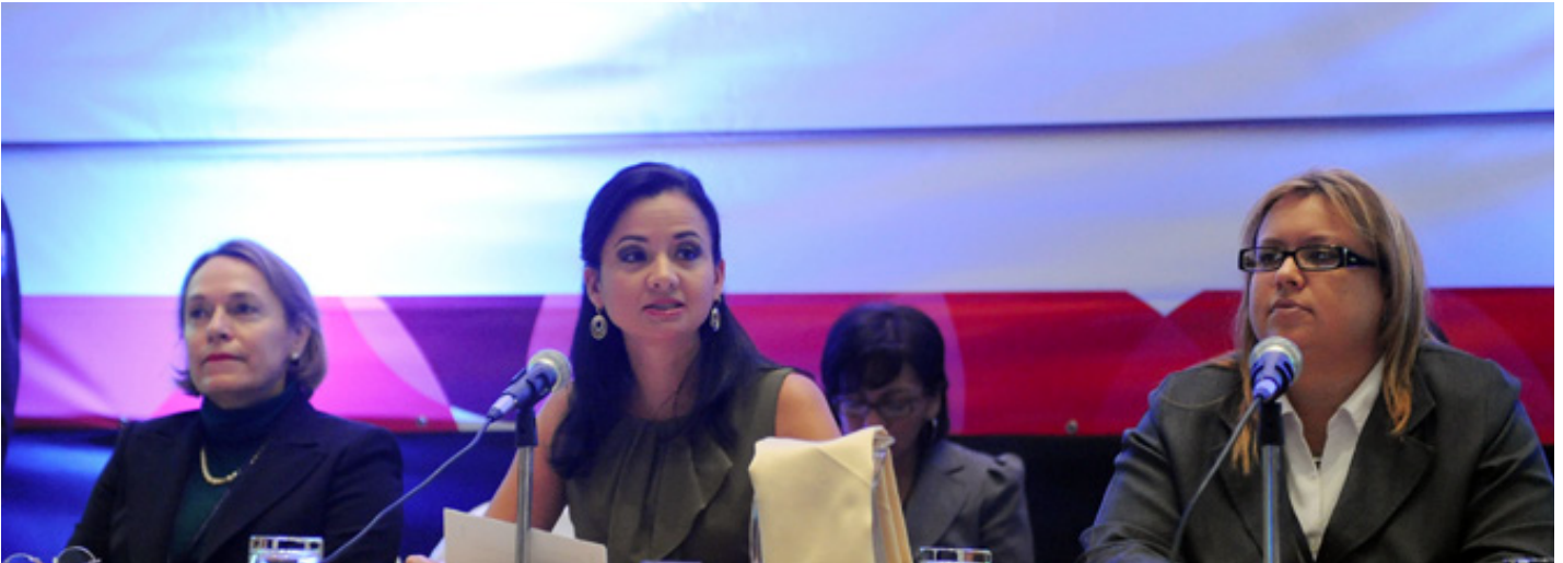
Marcela Aguiñaga, Ministra del Ambiente, Ecuador (centro)

recursos financieros para la lucha contra la desertificación y degradación de tierras en ALC, Alejandro Jacques del Mecanismo Global de la Convención de Naciones Unidas de Lucha contra la Desertificación (CNUCLD) hizo una presentación sobre los aspectos operativos de la EFIR (UNEP/LAC-IGWG.XVIII/9). Discutió un mecanismo para gestionar la estrategia y un plan de trabajo para asegurar su implementación, y un fondo pre-inversión de múltiples agencias con el objetivo de disparar US$500.000 millones en cinco años.