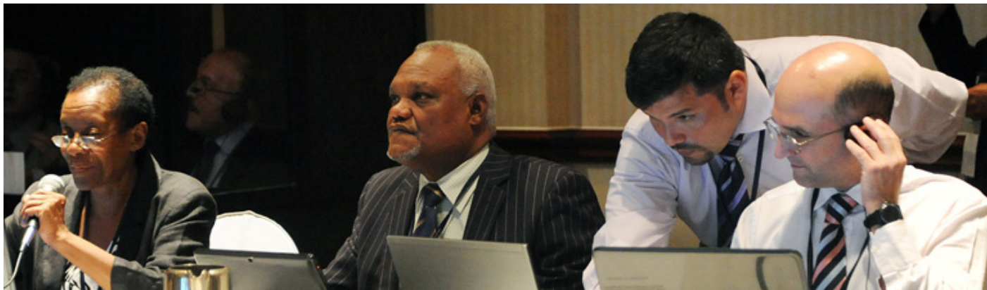
Los Vicepresidentes Jamaica y República Dominicana facilitaron el grupo de contacto sobre el borrador de declaración