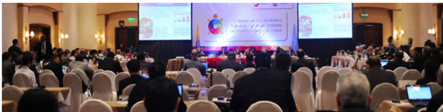
Delegados durante la sesión