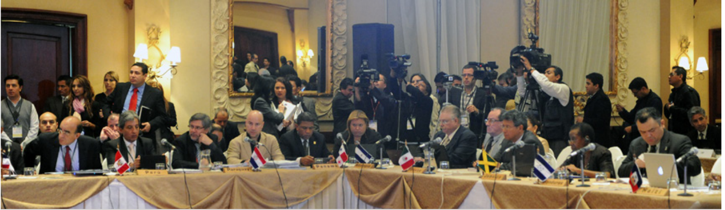
Ministros y jefes de delegación durante la sesión de inauguración del Segmento Ministerial

Bolivia identificó las siguientes temas para su inclusión en la Declaración: provisión de recursos financieros de los países desarrollados; articulación de los derechos de la Madre Tierra y la naturaleza, el derecho a salir de la pobreza, y los derechos de la cultura; la necesidad de disminuir la creciente brecha entre ricos y pobres; referencia al agotamiento de los recursos naturales debido a que se vive más allá de la capacidad de carga; y el establecimiento de un marco para un nuevo orden económico basado en la equidad, con criterios y mecanismos rigurosos.