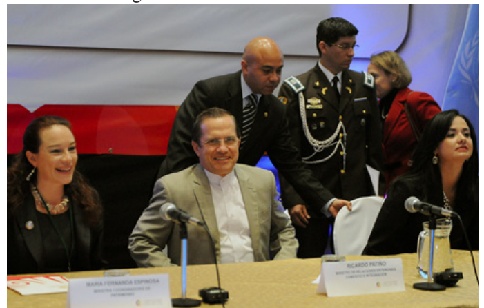
María Fernanda Espinosa , Ministra Coordinadora de Patrimonio, Ecuador, Ricardo Patiño , Ministro de Relaciones Exteriores, Ecuador, y Marcela Aguiñaga , Ministra del Ambiente, Ecuador

México, Chile y Costa Rica dijeron que no podían apoyar la inclusión de algunos de los derechos enumerados en un