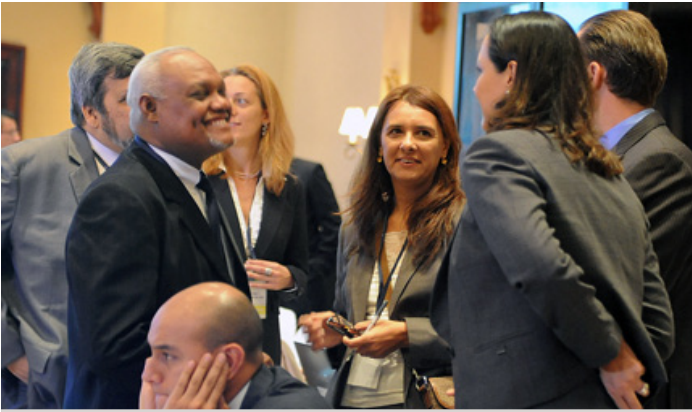
Delegados haciendo consultas antes de la reunión

había expresado inquietud sobre el acuerdo propuesto sino más bien urgido a que hubiera coordinación entre este acuerdo y los acuerdos globales pertinentes, y propuso un borrador de redacción a tal efecto.