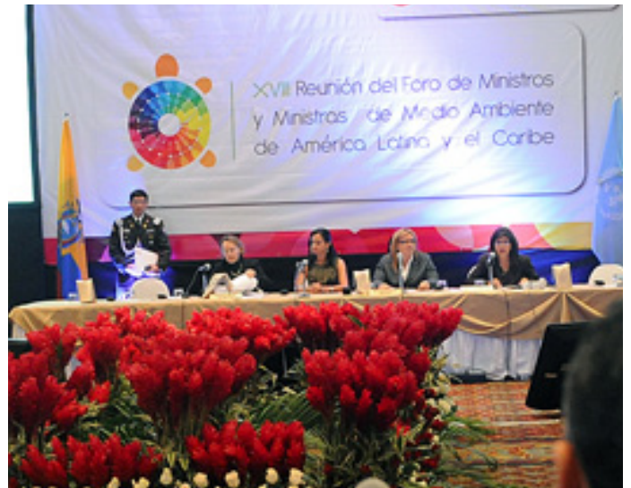
Vista de la sala durante la inauguración de la reunión

El Foro inició en 1982 con consultas intergubernamentales anuales llevadas a cabo por las más altas autoridades ambientales en los países de ALC, cada vez con sede en un país diferente. En 1985 las reuniones se convirtieron oficialmente en el Foro de Ministros de Medio Ambiente (FMA), y la