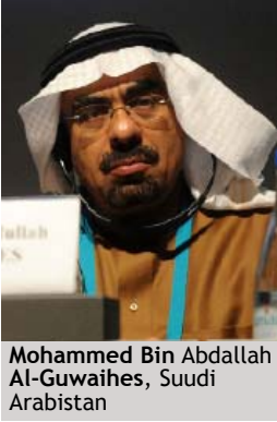
Mohammed Bin Abdallah Al-Guwaihes, Suudi Arabistan

Oturum yöneticisi Fas'tan Mohamed Saad El Alami, dünya nüfusunun yarısından çoğunun şehirlerde yaşadığını ve bunun yerel idareciler üzerinde ağır bir yük oluşturduğunu anlattı. Su kaynaklarının sürdürülebilirliğini hukuki ve politik açılarından temin etmek için işbirliğinin şart olduğunu belirtti.