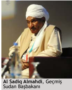
Al Sadiq Almahdi, Geçmiş Sudan Başbakanı

Irak Su Kaynakları Bakanı Abdulatif Rasheed, çoğu su kaynaklarının dış ülkelere sağlanmasından dolayı, Irak'ın "su garantisinin olmadığını" belirtti. Sayın Rasheed Türkiye