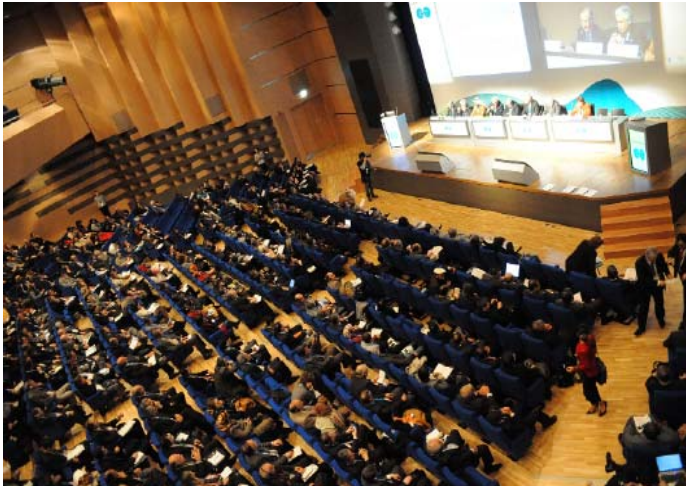
Yerel Yönetim ve parlamenterler arasındaki konuşmalardan kuş bakışı görüntü