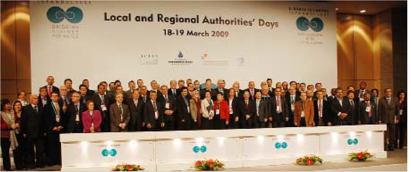
Yerel yönetim katılımcıları poz verirken

Oturum yöneticisi Fas'tan Mohamed Saad El Alami, dünya nüfusunun yarısından çoğunun şehirlerde yaşadığını ve bunun yerel idareciler üzerinde ağır bir yük oluşturduğunu anlattı. Su kaynaklarının sürdürülebilirliğini hukuki ve politik açılarından temin etmek için işbirliğinin şart olduğunu belirtti.