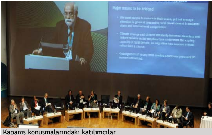
Kapanış konuşmalarındaki katılımcılar

Su ve tarım ile ilgili üç tematik oturuma katılan gazeteciler konu ile ilgili izlenimlerini özetlediler. Uluslararası Sulama ve Drenaj Komisyonu'ndan (USDK) Suresh Kulkarni "artan talebi karşılamak üzere yiyecek üretimi yapabilmek" konulu tavsiyeler, taahhütler ve inisiyatifleri sundu. Bu sunum artan yiyecek talebini karşılamak için kısa ve uzun vadeli çözümleri,