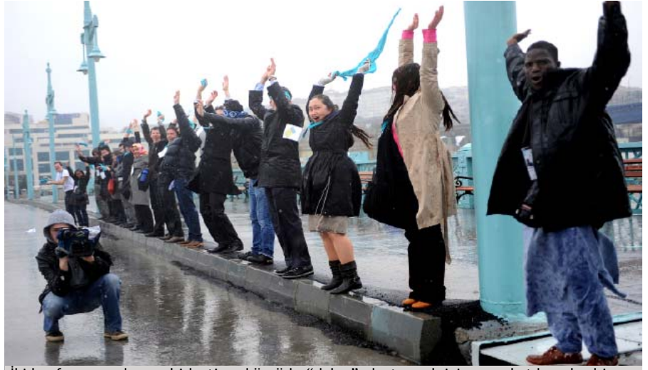
İki konferans mekanını birleştiren köprüde “dalga” oluşturmak için genç katılımcılar bir arada

Katılımcılar perşembe günü Akdeniz ve Arap ülkeleri bölgesel gruplarının oturumlarına katıldılar. Politik süreç, sabah yerel yönetimler ve parlamenterlerin konuşmaları, öğleden sonra İstanbul Su Uzlaşmasına uyum konusu ile devam etti. Tematik oturumlar “İnsan Kalkınmasının İlerletilmesi ve BKH” ve “Finans” konuları ile devam ederken, “Küresel Değişim ve Risk Yönetimi” ile beraber “İdare ve Yönetim” oturumları ile son buldu.