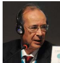
Oturum Başkanı Mohamed Saad El Alami, Fas

YEREL YÖNETİCİLER VE PARLAMENTERLER ARASINDA KONUŞMALAR: Çarşamba günü çeşitli toplantılardan sonra parlamenterler ve yerel su idarelerinden temsilciler merkezi yönetimin sorumluluğunun dağıtılması, su ve sanitasyon hakkının tartışılması için bir araya geldiler. Türkiye Büyük Millet Meclisi'nden Mustafa Öztürk toplantının tarihi önemine dikkat çekti ve parlamenterler ve yerel idareciler arasında işbirliğinin önemini vurguladı.