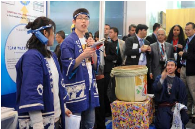
Su Fuarı'nda katılımcılar

Istanbul Belediye Başkanı Kadir Topbaş, bir "İstanbul Su Anlaşması (İSA)'nın son kabullenmesi" oturumuna başkanlık ettiği sırada, yerel ve bölgesel otoritelerin su güvenliğinin ve Bin Yıl Kalkınma Hedefleri (BYKH)'nin başarmaktaki görevlerinin üzerinde durdu. Ortadoğu ve Batı Asya Birleşik Şehirler ve Yerel Hükümetler Genel Sekreteri Selahattin Yıldırım, İSA'nın sadece bir anlaşma olmadığını, aynı zamanda daha uzun bir uygulama sürecinin başlangıcını temsil ettiğini not etti.