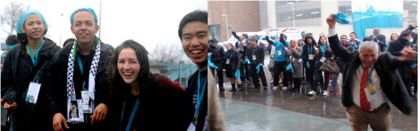
Gençlik Geçit Töreni fotoğrafları

GELECEK KÜLTÜREL FALİYETLER: Forumun kültürel etkinlikleri çerçevesinde katılımcılar için de 20 Mart Cuma akşamı saat 8:30 da Cemal Reşit Rey konser salonunda dünyaca ünlü vurmalı çalgı ustası Burhan Öçal tarafından bir konser verilecektir.